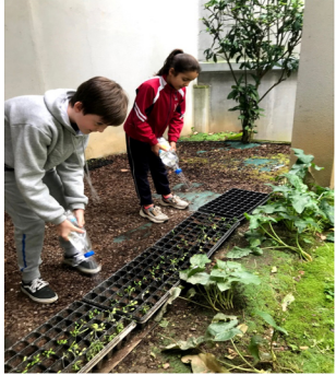
FERROL Redacción 5ºB EP

El Colegio Lestonnac, promueve el desarrollo del talento de su alumnado en todas sus dimensiones, contribuyendo constantemente a su formación queremos educar en valores y, al mismo tiempo, despertar la capacidad crítica para facilitar un conocimiento profundo de la realidad. Nuestra vocación es servir a nuestro entorno más próximo y siempre en beneficio de toda la sociedad. Por eso, nos esforzamos cada día por ofrecer una educación pensada para generar un impacto real allí donde estén presentes