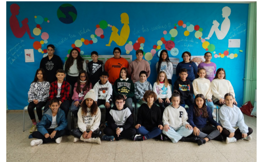
FERROL Redacción /6º EP

O alumnado de 6ºEP despois de compartir xuntos os tres cursos de educación infantil e os seis de primaria, realizaremos unha viaxe fin de curso a Cantabria.