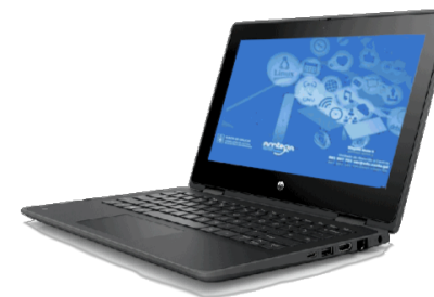
HP ProBook x360 11 G5 EE