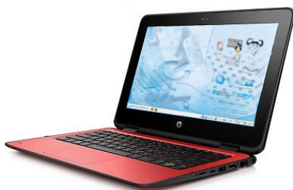
HP ProBook x360 11 G1 EE

No fogar, o/a alumno/a pode conectar o equipo a unha rede WIFI, igual que calquera outro dos seus propios dispositivos persoais.