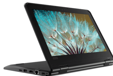
Lenovo Yoga 11e 5th Gen